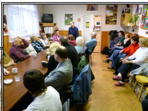
z motivačních programů